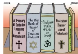
Организации, основани на идеология