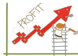
Други организации генериращи печалба