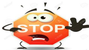
Организации, които не са регистрирани в трансграничния регион (извън изключенията)