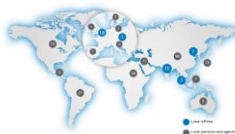
Регионални структури и клонове на организации, които не са публични власти